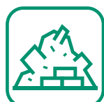
DÉBLAIS / GRAVATS

L'accès est interdit à tout véhicule et à toute remorque dont le Poids Total Autorisé en Charge (PTAC) est supérieur à 3,5 tonnes .