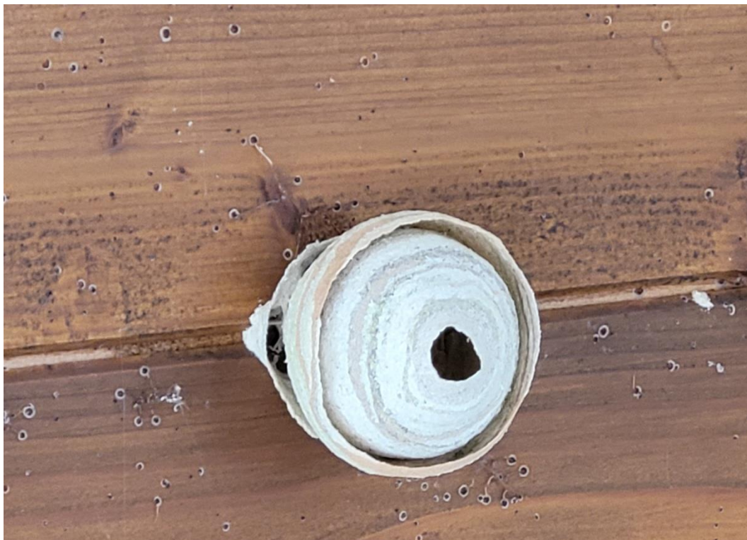
Nid primaire en formation